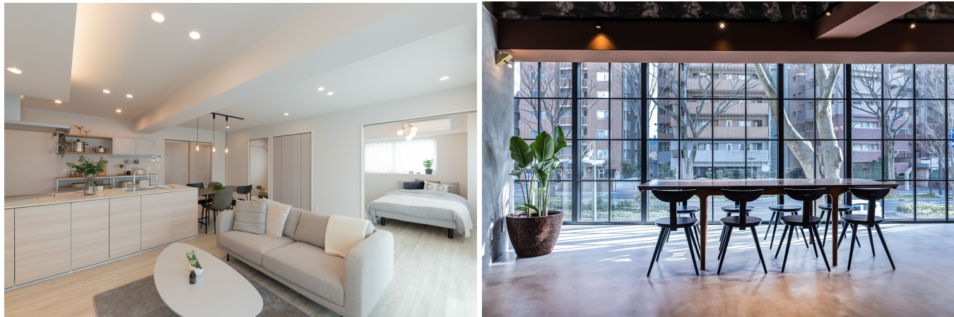
(右)築46年の分譲マンションを一棟丸ごとリノベーションしたシェア型複合施設「Blank」