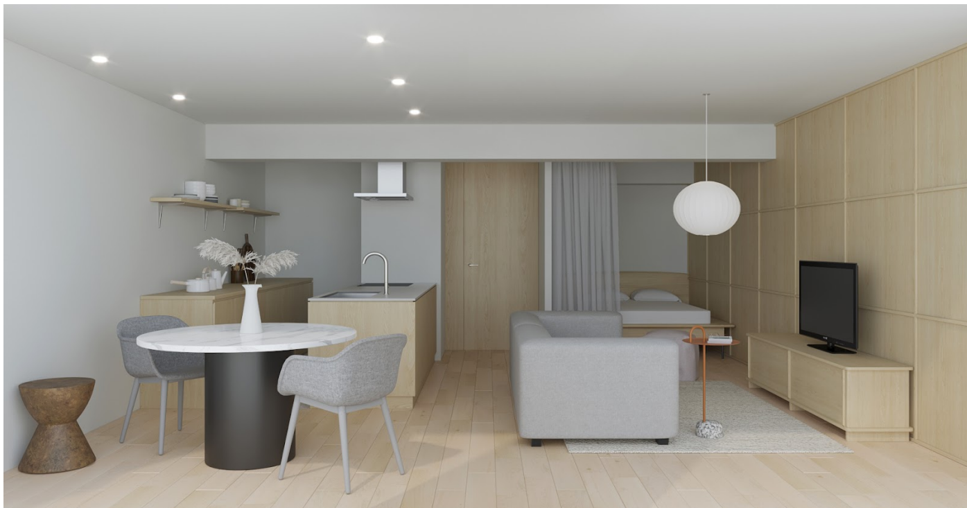
「リノベル。神奈川 横浜ショールーム」で再現されたsugataの「Baum(バウム)」テイストのイメージ画像

横浜駅徒歩7分、リラックス感のある雰囲気が魅力の61㎡のショールームは、DINKSやファミリーを想定した可変性のある1LDK。資産価値の落ちにくい立地や物件を選ぶことで、将来の売却や賃貸という選択肢も視野に入れた住まいです。家族の時間を大切にしたいと考え、寝室とフリースペースを最小限とし、LDKをゆとりのある広さにしました。また、洗面台を廊下に設けることで、帰宅後スムーズに手を洗うことができ、さらに浴室を広く取るという工夫も。キッチンの収納スペースを活用してルンバ基地を設けるなど、非接触・音声による家電一括操作が叶う最新のIoT機器を連携したスマートホームもご体感いただけます。今後、中古住宅購入やリノベーションについて気軽に学べるセミナーや予約制相談会などを随時開催してまいります。