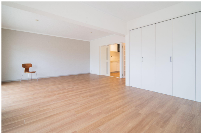
アクセント壁と床はそれぞれ3パターン