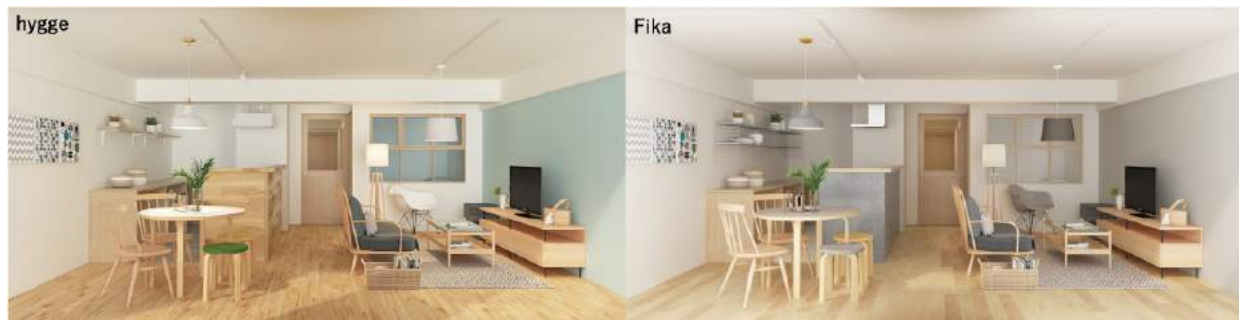
直近3カ月での人気上昇のテイスト「hygge」と「Fika」のイメージ

直近3カ月に絞ると、総合ランキングの1位と2位は変わらず、3位に5位の「hygge」、4位に8位の「Fika」がランクイン。白基調の木やパールトーンを用いた温かみのあるキレイめテイストの人气が急上昇しました。