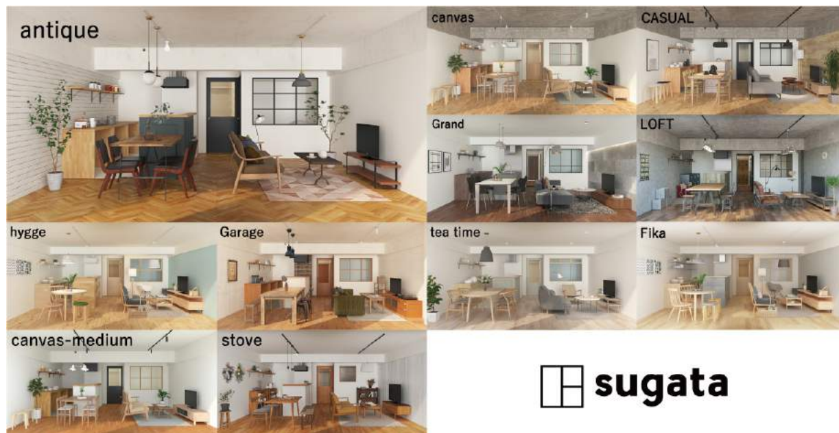
「sugata」人気テイストランキング上位ランクインのテイストイメージ一覧

sugataはお客様の住まいづくり体験の品質向上、設計施工業界の課題解決という2つの側面をもつプロダクトです。「リノべる。」はテクノロジーの活用を通じて、ミッションである「日本の暮らしを、世界で一番、かしくく素敵に。」の具現化に向けて邁進いたします。