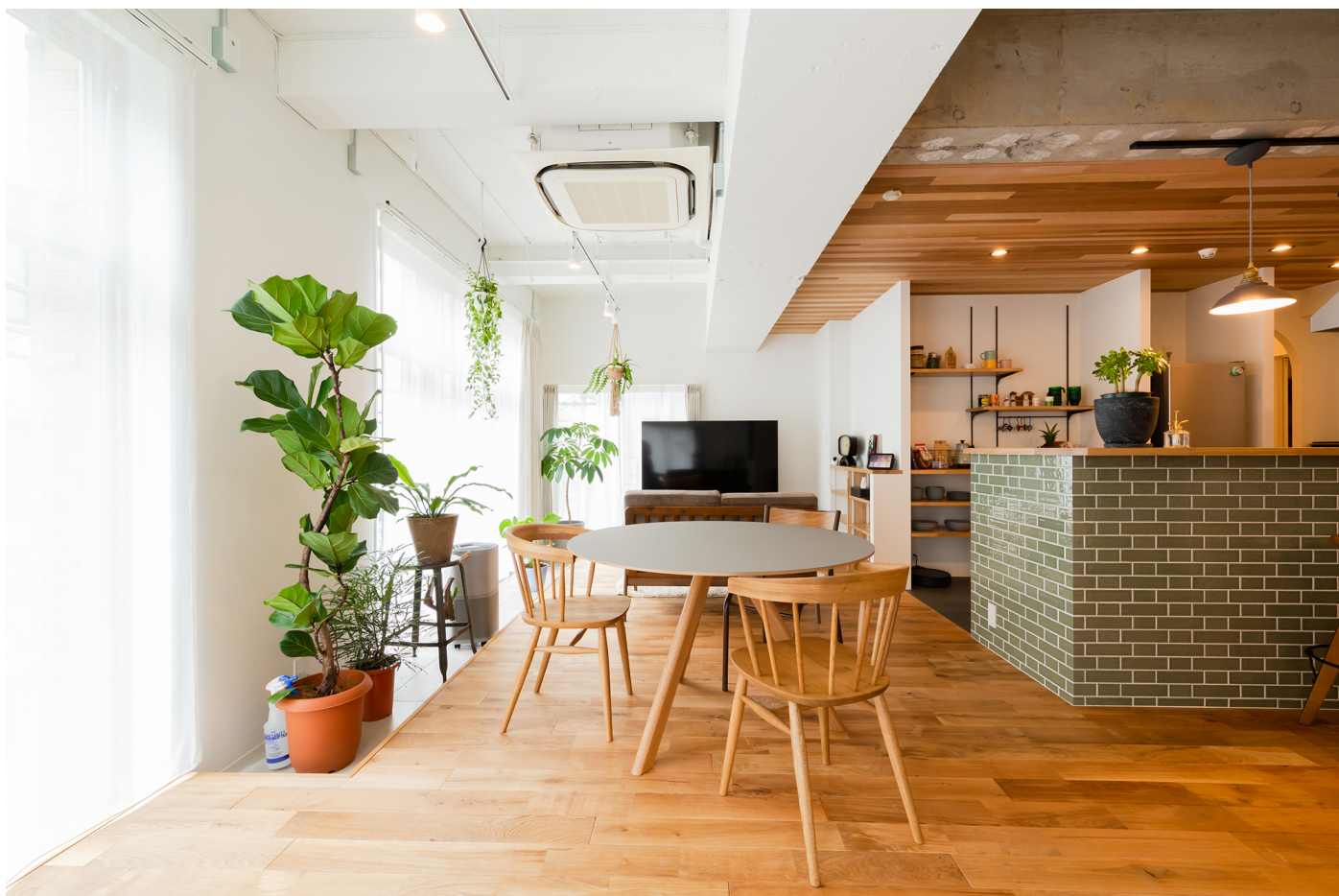
リノべる。 神奈川 相模大野ショールーム