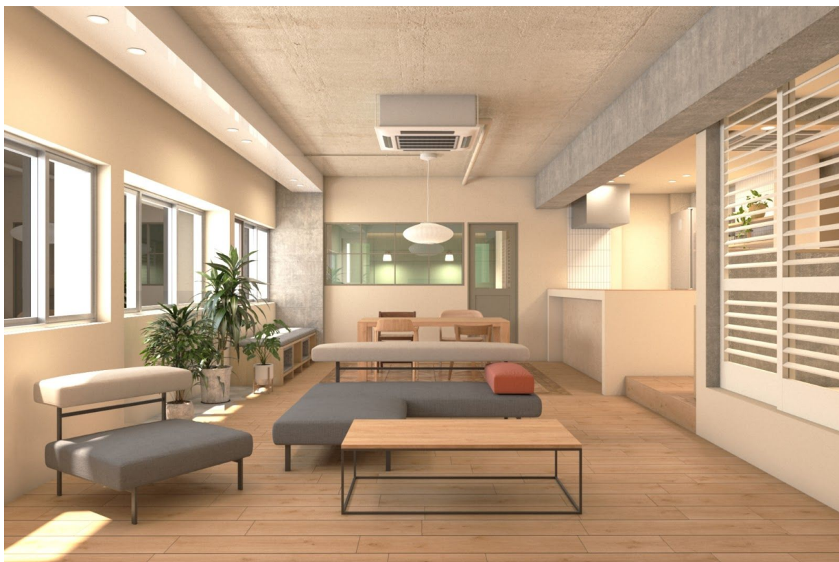
「リノベル。東京 表参道本社ショールーム」イメージ画像