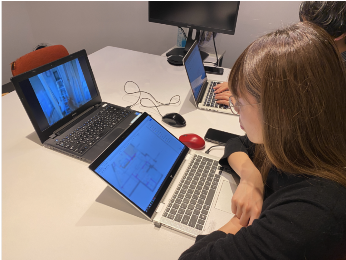
施工管理業務の遠隔化イメージ

遠隔管理の実現により、よりタイムリーな現地現物の確認や意思決定を行い、担当者がさらにクリエイティブで生産性の高い業務に時間をあてることで、お客様へのサービス提供価値や施工品質を向上させることが可能となります。