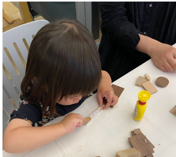
リノベル アップサイクルワークショップ イメージ