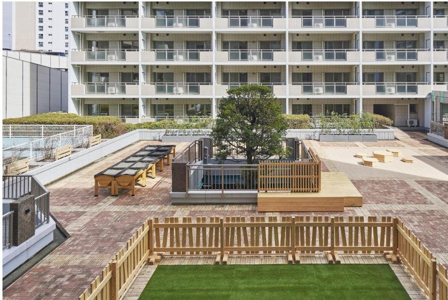
中庭に設置したドッグランや菜園、キッズスペースなど