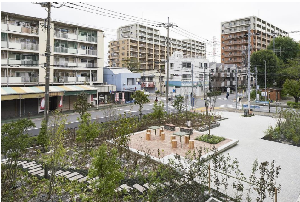
地域と繋がるランドスケープ

今までフェンスに囲われ閉鎖的だった外構は、店舗を軸にして地域に開く 2 つの広場を設置することにより、街とシームレスにつながるランドスケープへと生まれ変わりました。今まで中庭で使用していたレンガタイルをエントランスや中庭のアクセントとして使用したり、枕木をサインの一部として活用しています。工事で発生する残土は築山として利用することで、ランドスケープに起伏を創り出しています。また、既存コンクリートを解体した廃材を土留め兼エクステリアとして利活用することで、アップサイクルを実現しております。