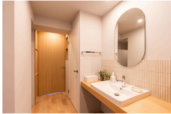
「リノベル。沖縄 西町ショールーム」イメージ画像